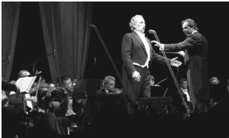
Konzert mit José Carreras in M'gladbach